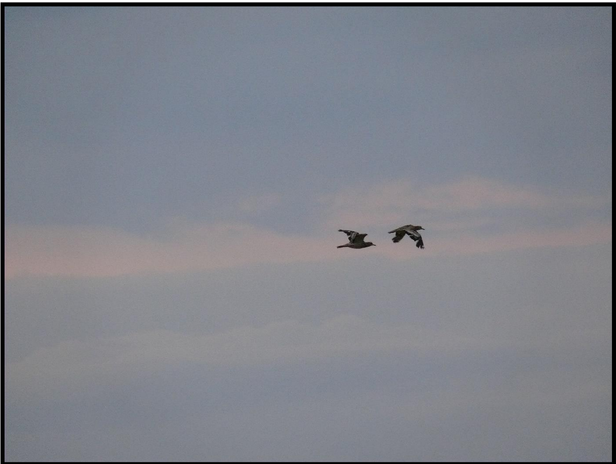
Ædicnèmes en vol.