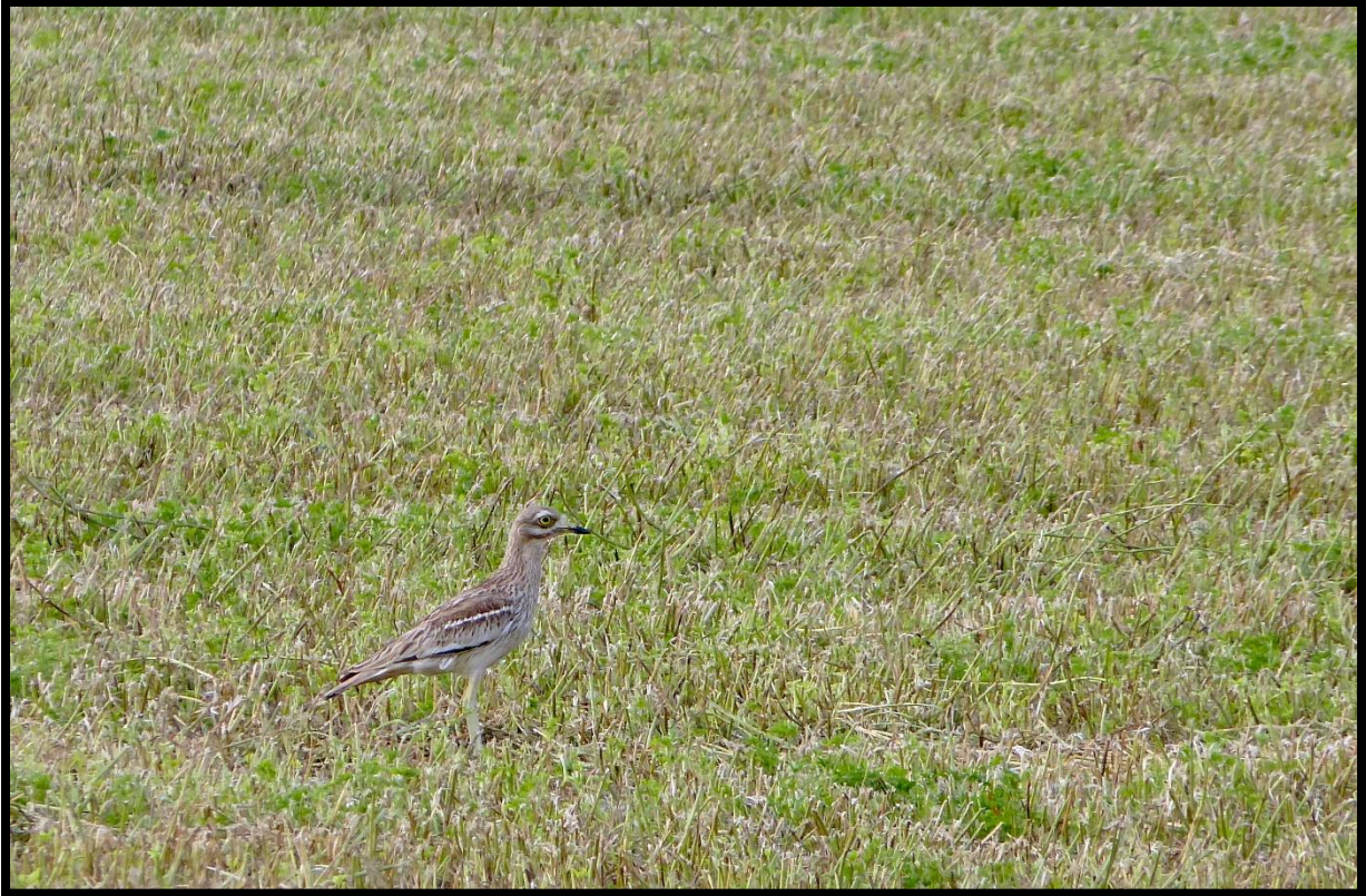
Œdicnème au sol.